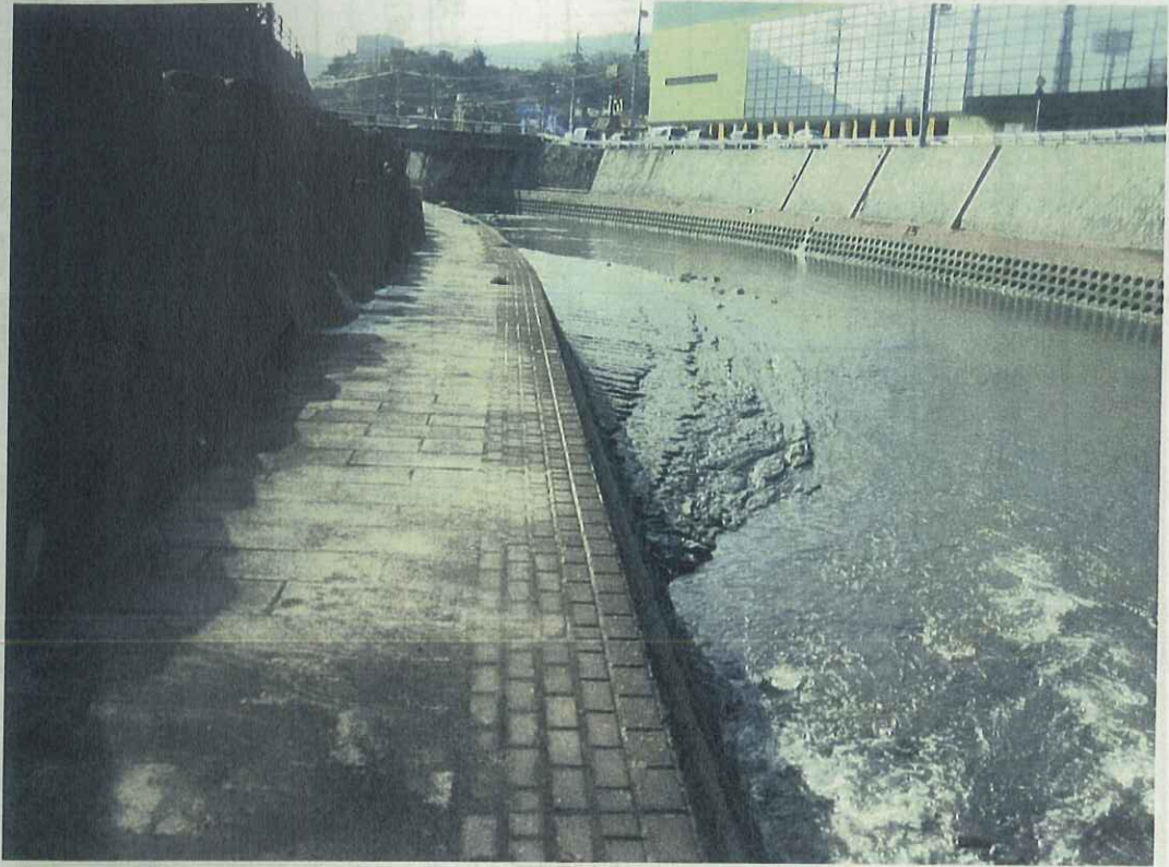
① ヤマダ電機横付近