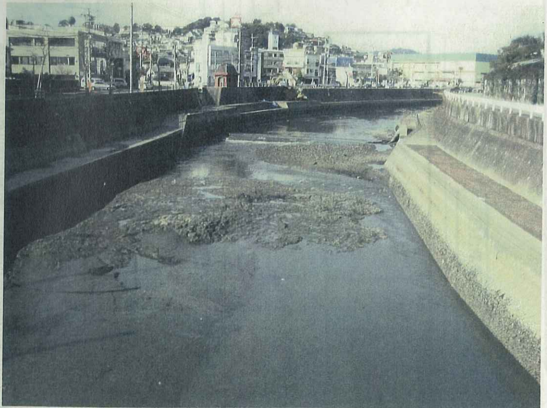
② 市民総合プール横付近